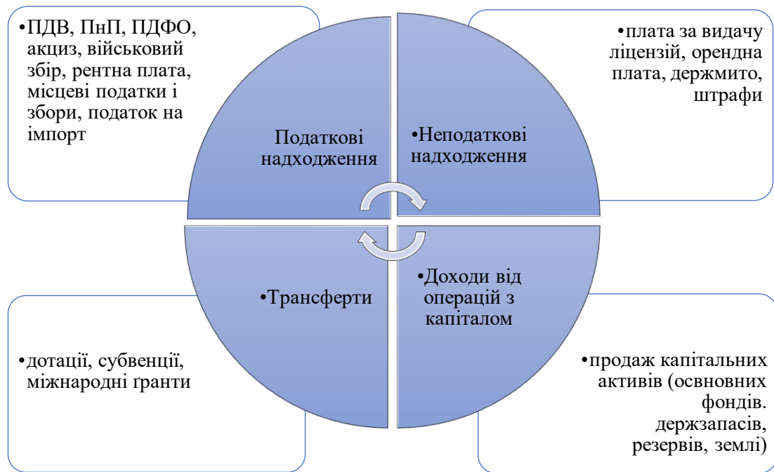
Рис. 1. Джерела формування Держбюджету України