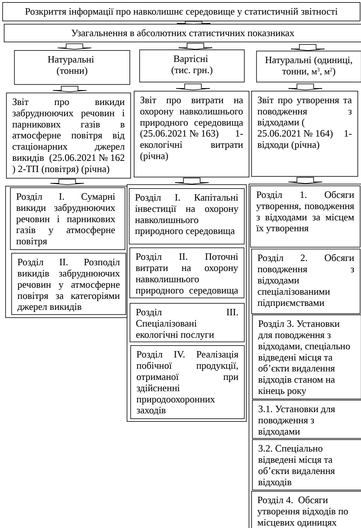
Рис. 1. Навколишнє середовище у статистичній звітності на 2022 рік*